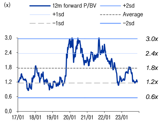
그림2 12M Fwd P/B 표준편차