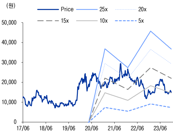
그림3 12M Fwd P/E 밴드