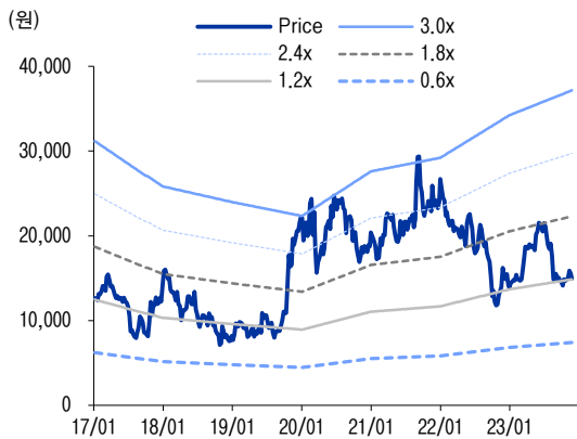
그림1 12M Fwd P/B 밴드

목표주가를 22,000원으로 하향(-15.4%)한다. 목표주가 조정의 배경은 주요 고객의 폴더블 제품 판매량 부진 및 이원화 리스크를 고려(ASP 압박 영향 등)하여 2024E 영업이익/OPM 전망치를 하향 조정했기 때문이다. 다만 주요 고객의 티타늄 케이스 탑재 확대 전개로 인한 수혜가 2024E부터 지속 증가할 것으로 예상되는 만큼 힌지 사업의 단기 리스크를 방어할 것으로 판단한다. 현 주가는 12M Fwd 실적 기준 P/E 10.2x, P/B 1.2x로 과거 밴드 평균을 하회하고 있다.