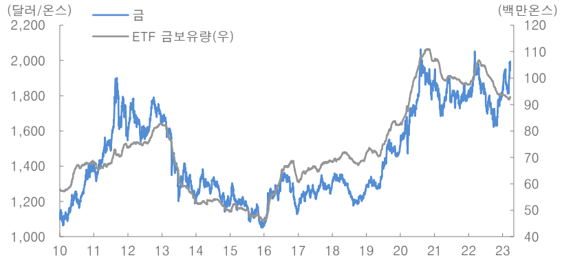
그림 2. 금 가격과 ETF 금 보유량 추이