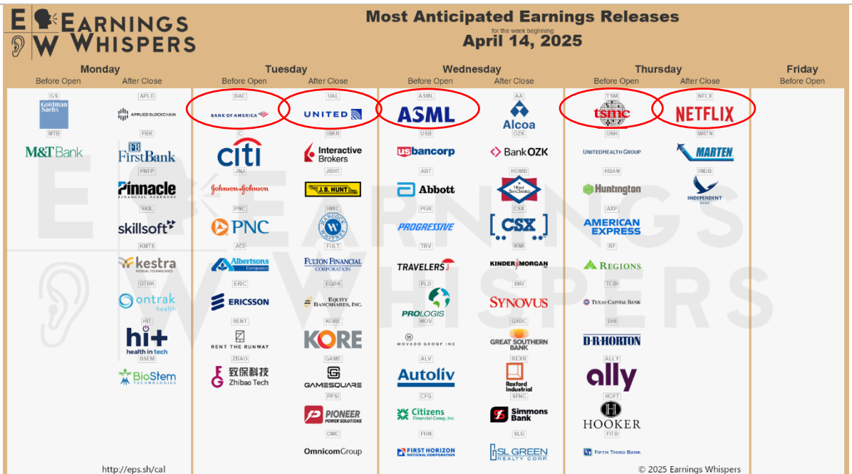
도표 5. 금주 주요 기업 실적 발표 일정