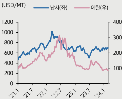
(자료: Ciscchem, 키움증권 리서치센터)