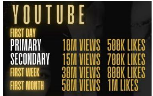
그림 2. 르세라핌_24년 2월 해외 팬덤 목표는 크게 확대