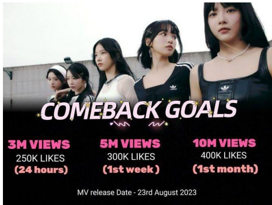
그림 1. 르세라핌_23년 8월 해외 팬덤 목표