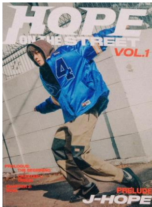
그림 3. BTS_제이홉 3월 29일 음반 발매 예정