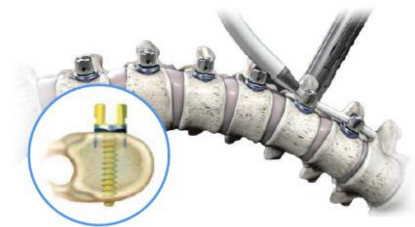
그림 2. 척추측만증 치료용 임플란트 테더