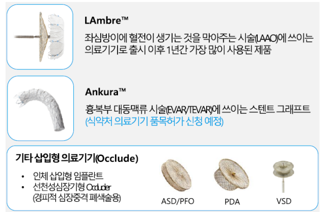
그림 4. 선건테크 제품 포트폴리오