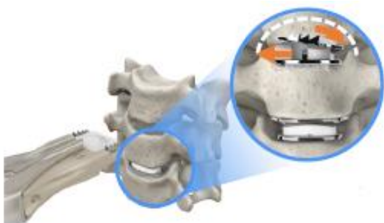
그림 1. 짐비사 모비 씨(Mobi-C)

23년 1월 국내 최초로 짐비코리아(ZimVie Korea)와 경추-척추 치료용 의료기기 국내 총판 계약을 체결. 경추인공디스크 모비 씨(Mobi-C)를 국내에 유통하고 있으며 향후 소아청소년용 특별성 척추 측만증 치료용 임플란트 테더(Tether) 등으로 품목을 늘릴 예정. 기존 짐비사 대리점망의 매출이 온전히 반영되어 안정적 영업실적에 기여할 것으로 판단