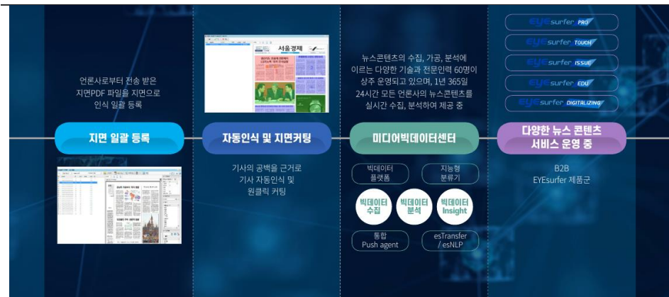
그림 2. 아이루트 기술 특징

지난 10월 런칭한 ‘RDP-LINE’은 뉴스 데이터를 생성형 AI 개발 기업에 훈련용 데이터 세트로 제공하는 서비스이다. 동사가 대규모 뉴스 데이터를 빠르게 구축할 수 있었던 이유는 주요 기술인 ‘아이루트’에 있다. 아이루트는 OCR, 레이아웃 자동인식, 라벨링 등이 적용된 전처리 기술로 지면 데이터의 수집 난이도를 낮추어 뉴스 데이터 아카이브를 구축하는데 기여한다.