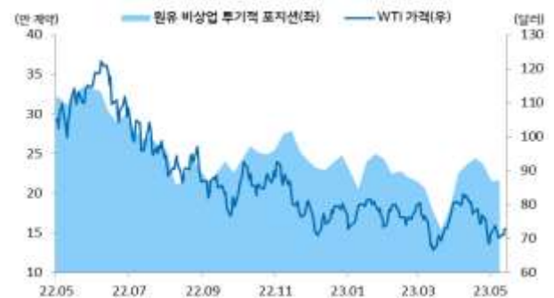
국제유가 및 투기적 포지션 동향