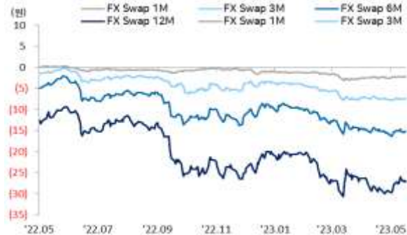
FX Swap Point