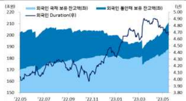
국내 채권시장 외국인 보유잔고 및 듀레이션