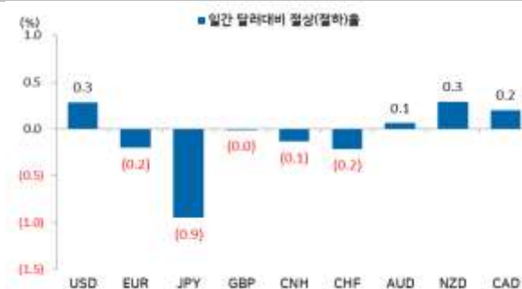
일간 주요통화 달러대비 절상(절하)율