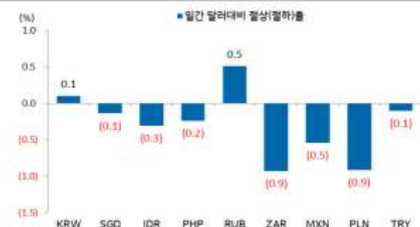
일간 신흥국, 아시아통화 달러대비 절상(절하)율