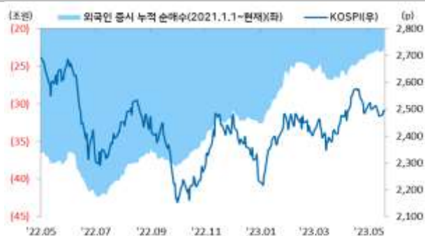
KOSPI 지수, 외국인 순매수 동향