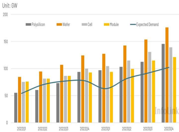
그림 3. Tier-1 태양광 업체들의 생산능력과 세계 수요 추이/전망