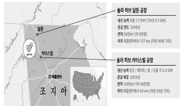
그림 2. 한화솔루션 미국 솔라 허브 위치