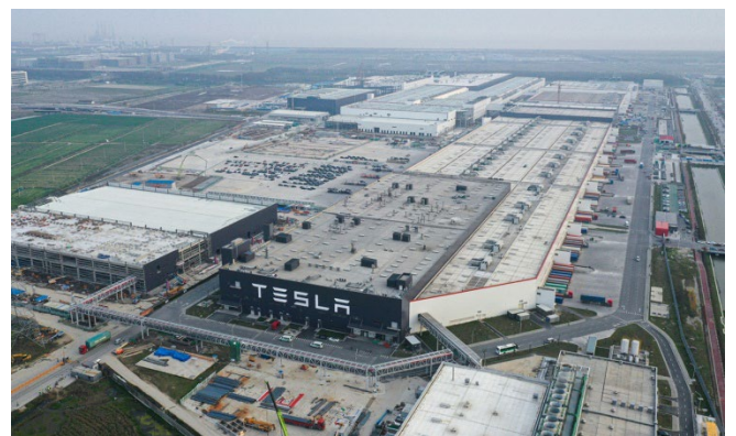
Tesla 상하이 기가팩토리 개요