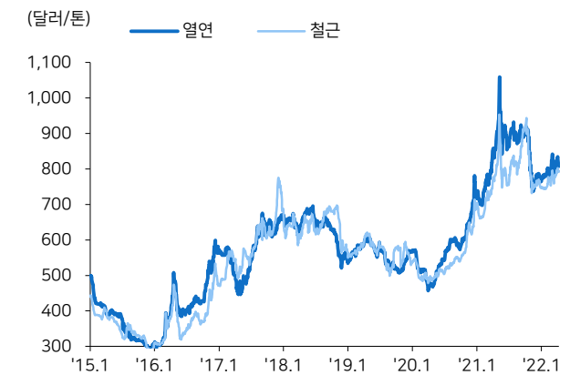
그림2 중국 강종별 가격 추이