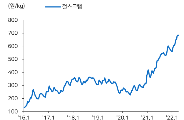
그림4 철스크랩 국내 유통 가격 추이