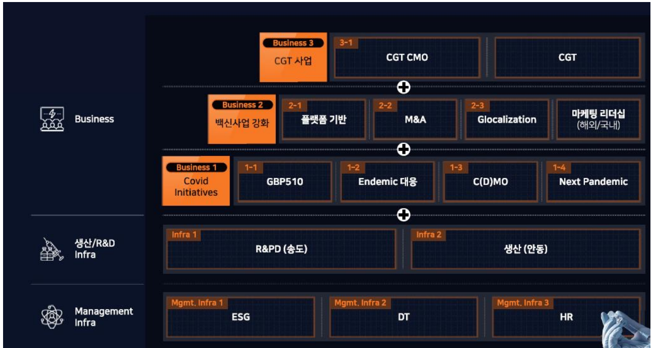
자료: SK바이오사이언스, 키움증권 리서치센터