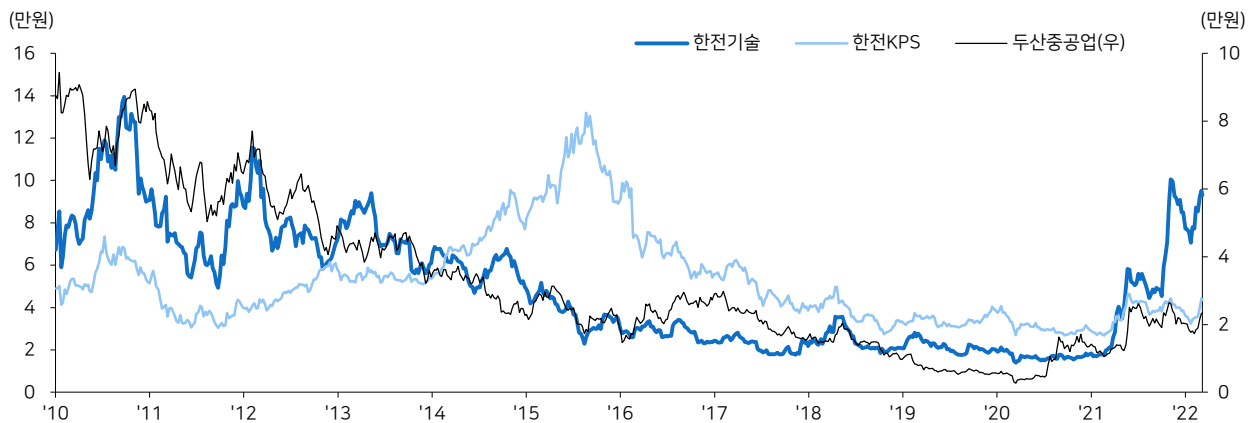
그림3 원전 관련주들의 주가 추이

중장기적으로는 에너지 위기, 러시아-우크라이나 전쟁 이후 글로벌 원전 프로젝트가 늘어나는 흐름이 명확하다는 점, SMR 프로젝트 역시 시작되고 있다는 점에 주목한다. 향후 추상적인 흐름이 실질적인 수주 확대로 이어지는 시점에서 원전 건설 밸류체인에 대한 적극적인 매수 전략이 유효할 전망이다.