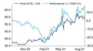
Share price performance relative to TAIEX

Previous Target NT$55.0 Close Price (Aug 25, 2021) NT$56.0