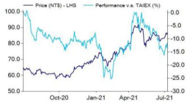
Share price performance relative to TAIEX

Previous Target NT$98.0 Close Price (Jul 08, 2021) NT$85.5