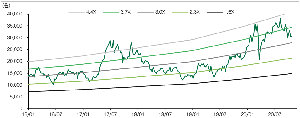
도표 4. 덕산네오룩스 PBR 밴드 차트