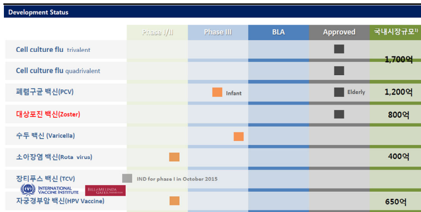
그림 2. SK 바이오사이언스의 R&D 파이프라인 현황