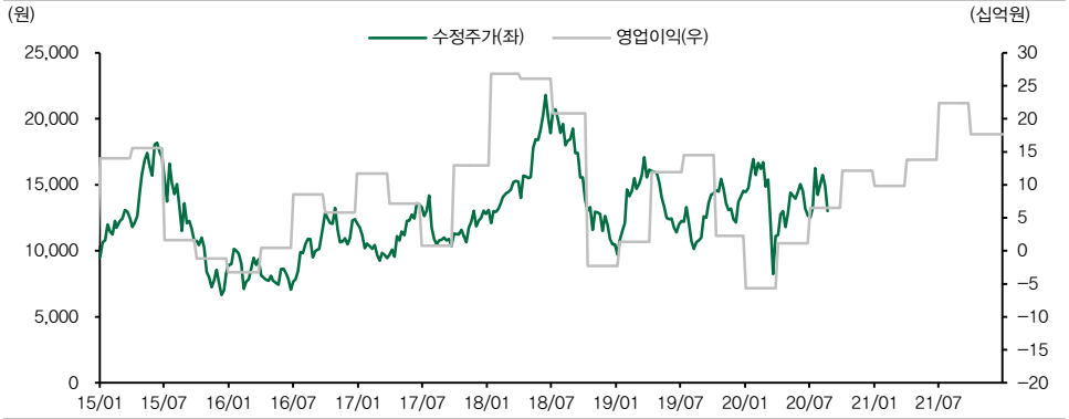
도표 2. 유니테스트 실적 추이 및 전망