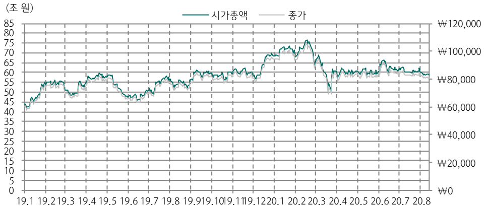
그림 1. SK하이닉스의 시가총액 및 주가 추이와 월별 이벤트