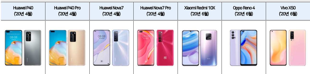
그림2 2Q20 중화권 스마트폰 OLED 모델 (출시 월)

주요 스마트폰 세트업체: 삼성전자, 애플, 화웨이, 오포, 비보, 샤오미 자료: Counterpoint, 메리츠증권 리서치센터