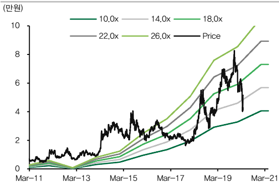
도표 2. 아프리카TV 12M Fwd. P/E 밴드