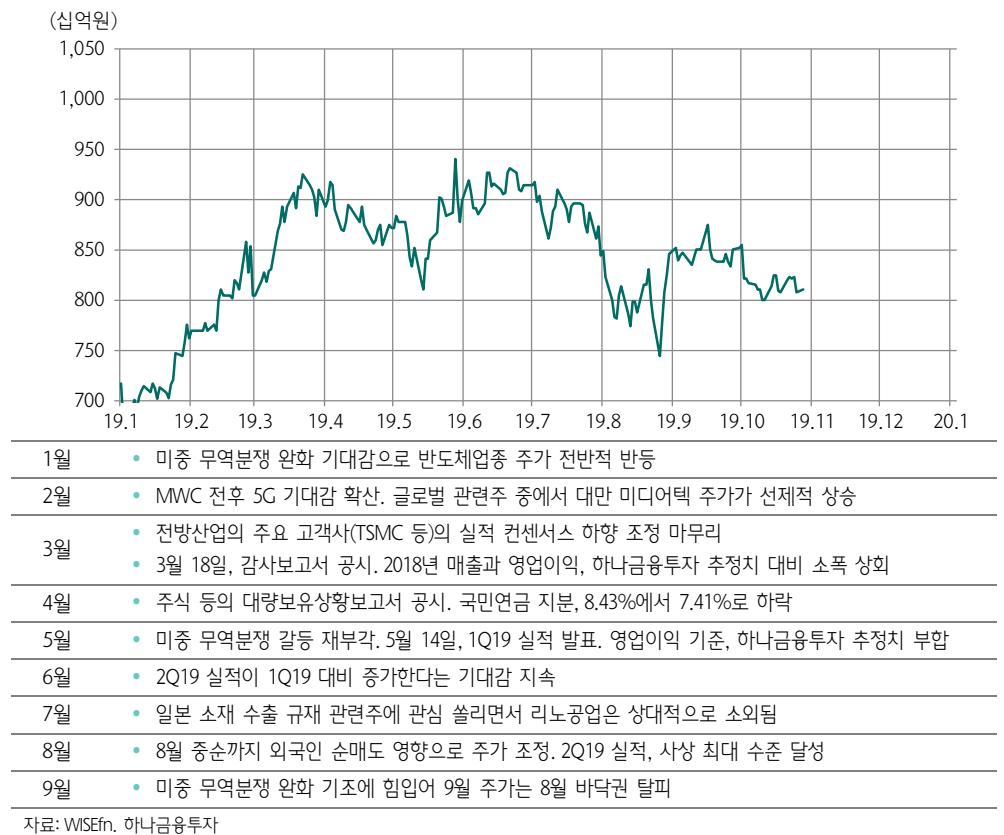
그림 1. 리노공업의 시가총액 추이와 주요 이벤트(2019년)