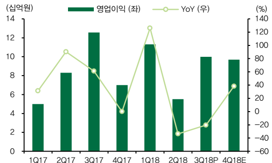
도표 4. 영업이익과 YoY 성장률