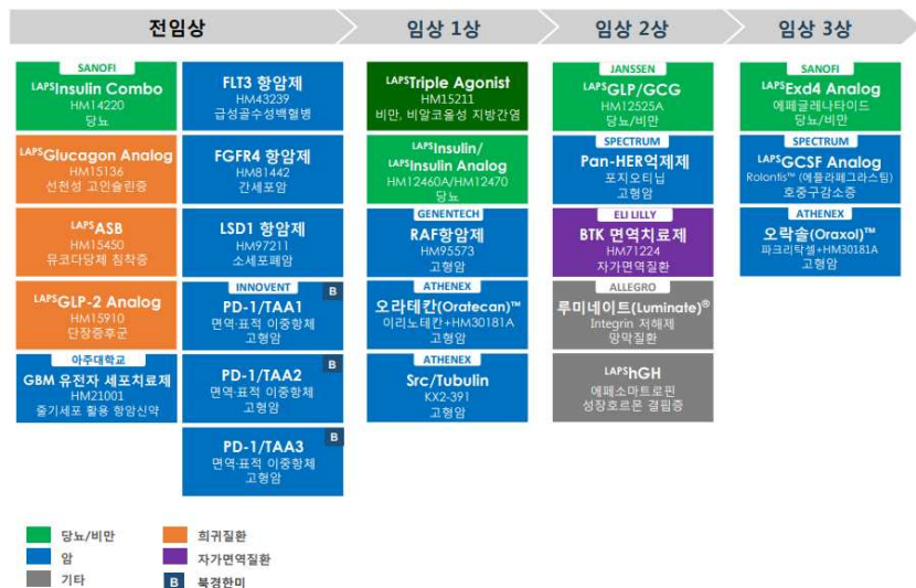
[그림 1] R&amp;D 파이프라인