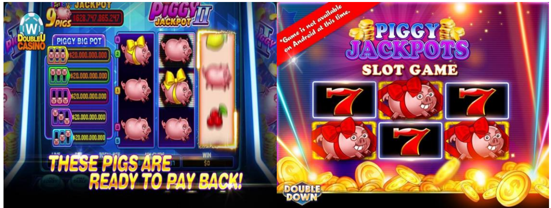
그림 1. DUC와 DDC에 런칭된 “피기 잭팟(Piggy Jackpots)” 슬롯게임